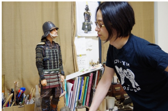
野口哲哉アトリエより