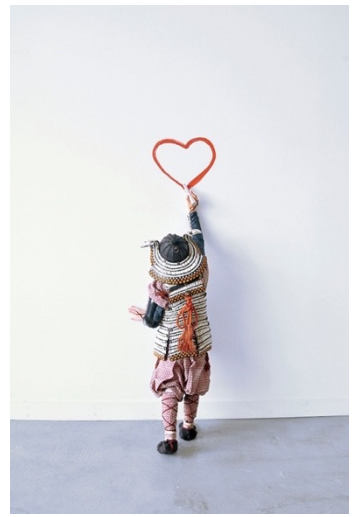
1.《floating man》2025年 ミクストメディア